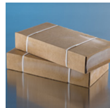
Scheiben in Kartonhülle

Catering, Lager- und Transportkühlung, Aufrechterhaltung der Kühlkette, Labor