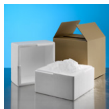
Polystyrol-Isolierbox (3 Größen)

Pellets (1,6 mm, 3 mm, 16 mm, lose oder im Beutel): 200 kg